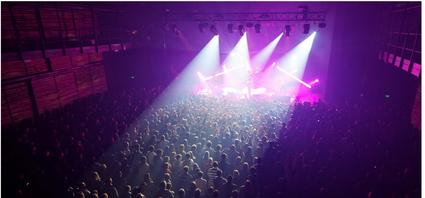
Grande salle - Pony Pony Run Run 01/12/2010