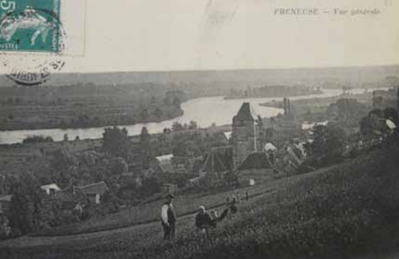
Vue générale vers l'ouest vers 1910. Coll.AC Freneuse