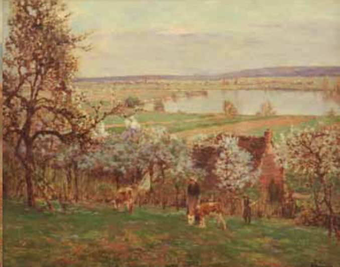
Chez Marie au printemps, huile sur toile, limite 19 e - 20 e siècle