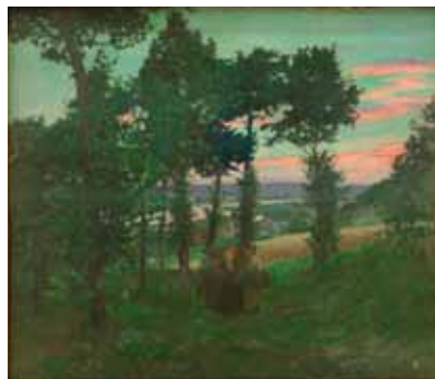
Un soir au temps des moissons, huile sur toile, limite 19 e - 20 e siècle

Pour peindre ce tableau, Bouchor s'est placé à mi-pente de la crête, au-dessus des maisons. Le couvert végétal est plus important aujourd'hui et le cours de la Seine différent, le coude de la Bosse des Vannes, bien visible en arrière plan, ayant été remblayé vers 1930.