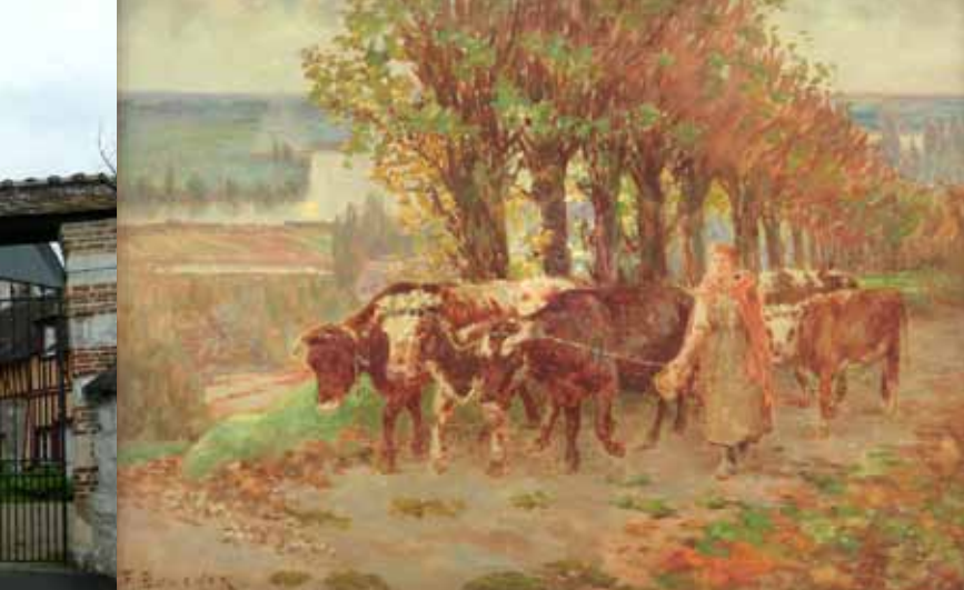
Maria conduisant ses vaches sur la côte, huile sur toile, limite 19 e - 20 e siècle