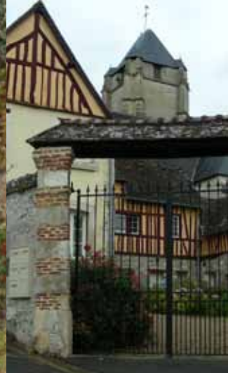
Vue actuelle de l'ancien presbytère