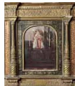
Vierge du Rosaire de San Giacomo de Venise, huile sur bois (?), s.d.

Chœur et clocher du 16 e siècle, nef reprise au 18 e siècle. À droite de l'entrée, l'ancienne chapelle des fonds baptismaux (1780) est dédiée à Saint-Expédit. À l'intérieur (non accessible) : Vierge du Rosaire de San Giacomo de Venise réalisée lors d'un voyage en Italie et comprise dans les œuvres données par l'auteur à la commune de Freneuse.