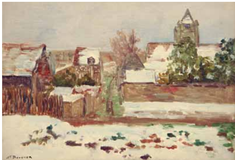
L'église par la neige, huile sur toile, limite 19 e - 20 e siècle

A Freneuse, Bouchor peint en extérieur, mais se déplace peu : sa maison, celle des voisins, le bras de Seine, la plaine, le carrefour de Saint-Christophe qui domine l'église. Il y saisit les travaux et