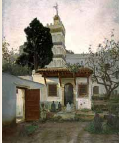
La mosquée Sidi Abder Rhaman à Alger, 1888. Huile sur toile, Noyon, musée du Noyonnais, inv. MN 127

Comme de nombreux peintres de sa génération, Bouchor découvre la Normandie dans les années 1880, et s'installe à Freneuse vers 1886. Il quitte le village en 1901, mais y revient régulièrement jusqu'à sa mort. Devenu peintre de l'armée, Bouchor montre les champs de bataille de la première Guerre Mondiale et la vie des soldats sur le front, mais dresse aussi le portrait de chefs militaires et d'hommes politiques. Il sera