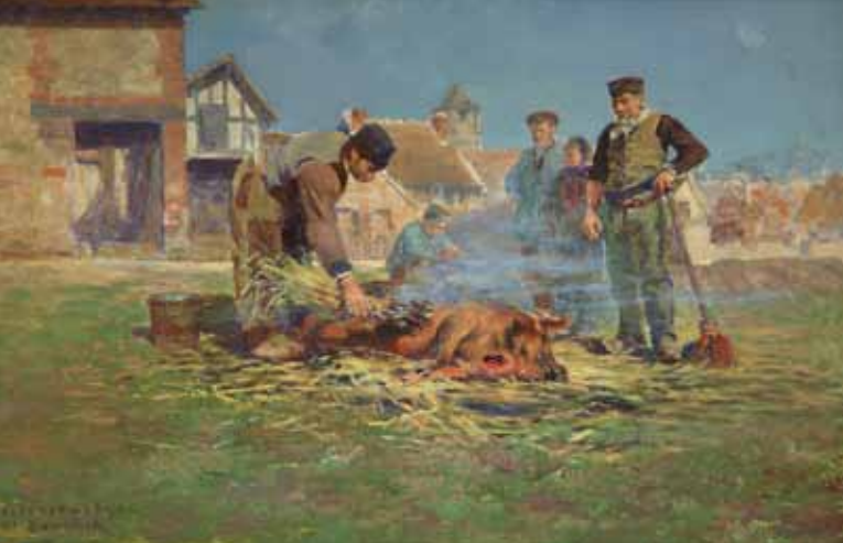
La flambée du cochon, huile sur toile, 1891

Redescendre la rue Bouchor puis poursuivre la descente sur environ 300 mètres en contournant le monument aux morts (par Delandré, 1920) et passant entre le manoir de Freneuse (13 e - 18 e siècle) et l'ancien bailliage seigneurial (1707) ; retrouver à gauche l'aire de stationnement, site de La Flambée du cochon.