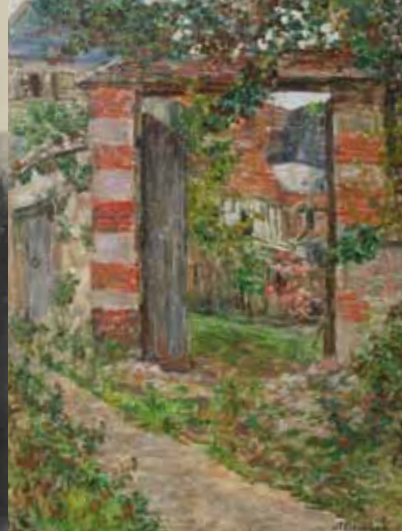
La porte de ma maison, huile sur bois, limite 19 e - 20 e siècle