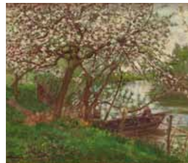
Le port de Maria, huile sur toile, limite 19 e - 20 e siècle

Saint-Christophe, font clairement référence à l'impressionnisme. Dans tous les cas, la composition reste classique, le plus souvent frontale ( Les Moyettes dans la plaine ) ou rayonnante ( Les Moutons sur la route du château ). Ces paysages sont aujourd'hui encore aisément identifiables et font des œuvres de Bouchor de véritables témoignages de l'évolution de la topographie du village depuis un siècle.