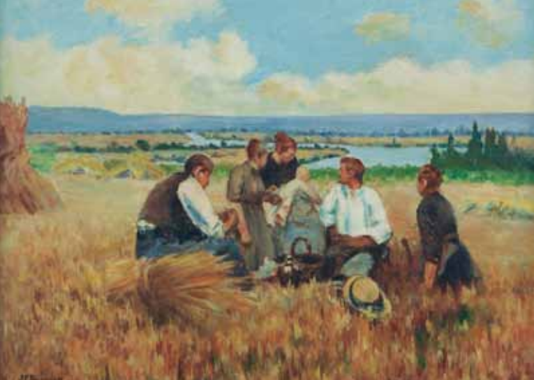
La collation des moissonneurs, huile sur toile, limite 19 e - 20 e siècle

les jours du monde agricole : La cour de la ferme, La collation des moissonneurs, Le cidre nouveau, La cueillette des pommes... Un quotidien au rythme immuable, dans lequel la technologie n'a pas de place : pas de véhicule à moteur mais des outils de bois, des paniers d'osier et des barques glissant sur l'eau. Aucun drame, aucune violence, sauf sur le cochon que l'on flambe sur la place du village ! « Monsieur Bouchor voit la campagne avec des yeux de poète » écrit en 1892 dans L'Illustration , le critique d'art Alfred de Lostalot. S'il pratique, comme d'autres artistes de son temps, ce que Maupassant nomme, d'une manière un peu péjorative, « le genre paysan », il le fait avec sensibilité, prompt à