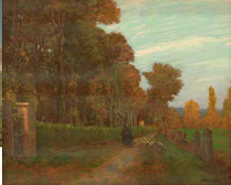
Moutons sur la route du château, huile sur toile, limite 19 e - 20 e siècle

À 800 m, sur la commune de Sotteville-sous-le Val, après le château du Val-Freneuse, la ferme du Val, représenté par Bouchor dans Le Vieux poirier devant la ferme et un paysage plus large réalisé au pastel.