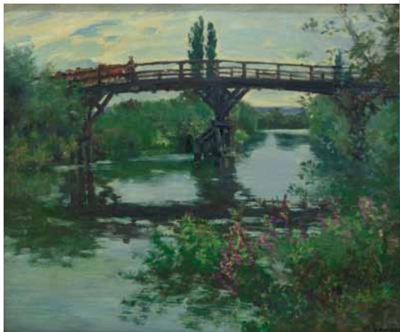
Le pont de Freneuse, huile sur toile, après 1896