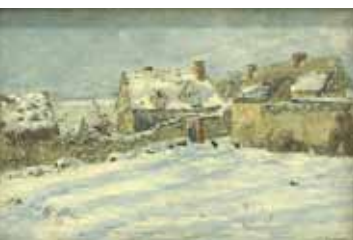
Mon mur et la maison de Maria par la neige, huile sur toile, limite 19 e - 20 e siècle

En sortant, longer l'église par la droite, prendre la Sente du cimetière, sentier pentu qui monte le long du coteau et aboutit à la partie haute de la rue Bouchor, communément appelée « Côte de Saint-Christophe ». Monter une centaine de mètres jusqu'au Carrefour de Saint-Christophe.