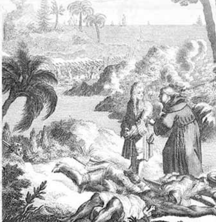
REPRÉSENTATION DE LA MORT DE CAVELIER

de La Salle expirait sans avoir pu parachever son rêve, la liaison sud-nord par le Mississippi. Les comploteurs effarés par leur geste finirent par s'entretuer. Les quelques mutins survivants se réfugièrent chez les indiens (on imagine leur sort) ou furent fait prisonniers plus tard par les Espagnols pour finir leurs jours dans les mines.