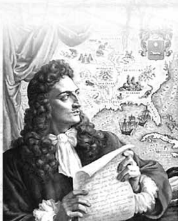
GRAVURE DE CAVELIER PAR JULES ADELINE CONSERVÉE À LA BIBLIOTHÈQUE DE ROUEN

région de Kingston au Canada). Il poursuit ainsi son commerce de pelleterie avec les Iroquois. En 1678, Louis XIV le félicite et l'encourage à nouveau. Il peut continuer ses découvertes... mais à ses frais ! Il lui accorde cependant le monopole des peaux de cibola, c'est-à-dire de bisons mais surtout son grand projet va pouvoir être mis à exécution.