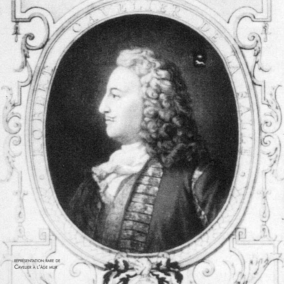
REPRÉSENTATION RARE DE CAVELIER À L'ÂGE MUR